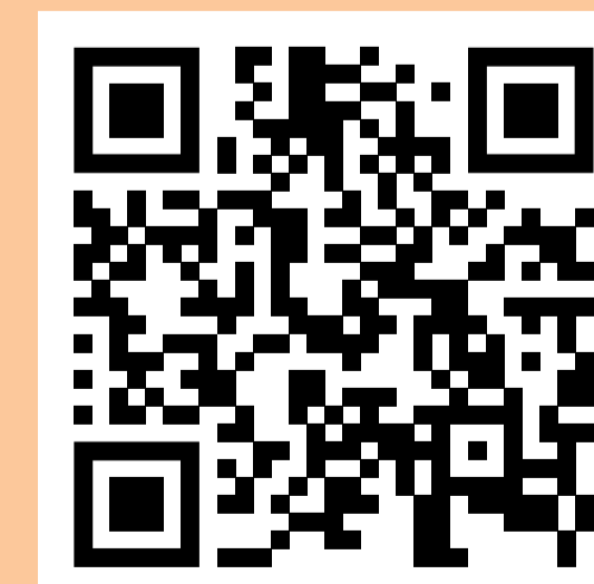
Samenwerking met externe partners, huisartsen en expertiseteams