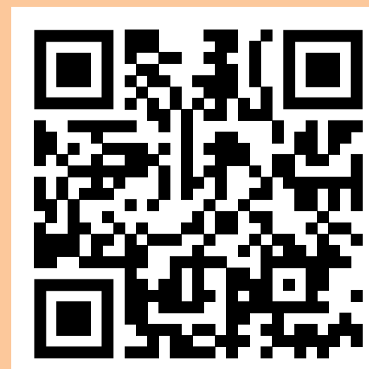
Werken in een MG

In de volgende cycli worden resultaten uitgediept en nieuwe informatie opgehaald.